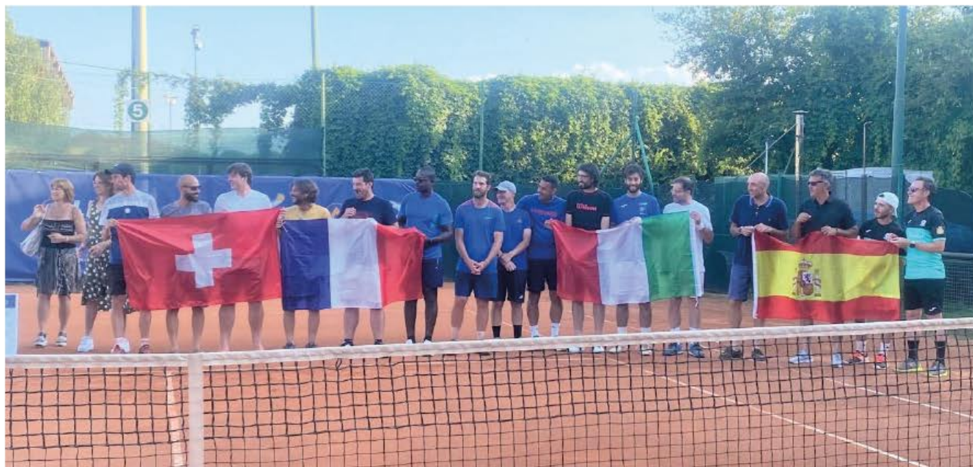
Remise de la coupe pour la 3 e place obtenue par le TCG lors du Tournoi des 4 nations en Italie du 25 au 26 juin 2023. L'hymne national des 3 équipes montées sur le podium a retenti. Le TCG a eu droit à la Marseillaise.

Au Tournoi international des 4 nations à Pinerolo (Italie)