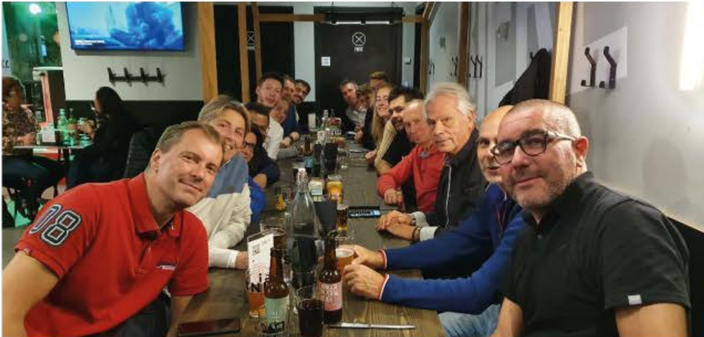
Soirée team building, octobre 2021

eux ont été très intenses. J'espère leur avoir montré le chemin... en m'investissant beaucoup auprès d'eux.