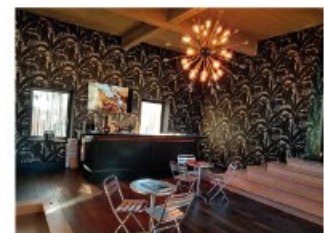
Un bar pour déguster les cigares façonnés au sein du domaine

Pour toutes informations : valery@precredit.com - tel : 03 85 23 12 34