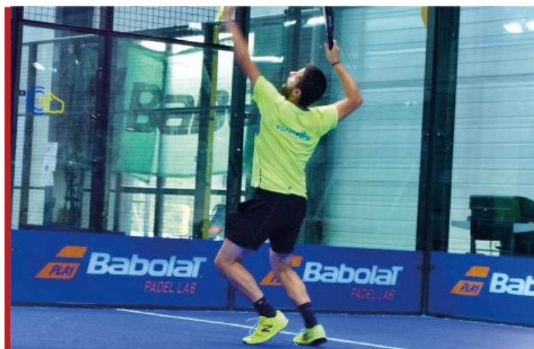
ESPRIT PADEL SAINT PRIEST