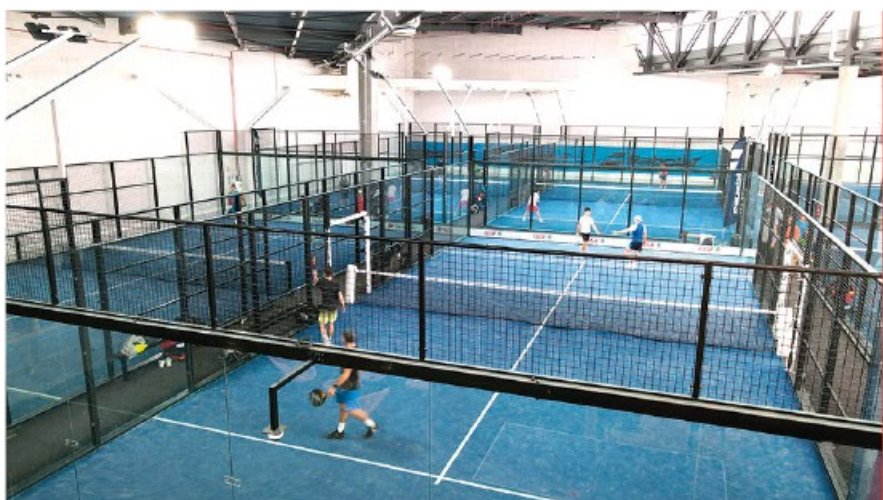
ALL IN PADEL DÉCINES