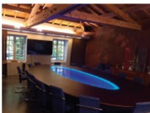
Une salle de réunion pouvant accueillir 24 personnes

Un caveau aménagé accueillant jusqu'à 200 personnes