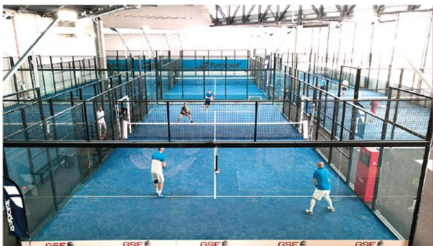
ALL IN PADEL VILLEFRANCHE-SUR-SAÔNE